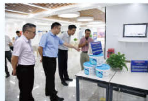
江门市珠西科创中心成果展