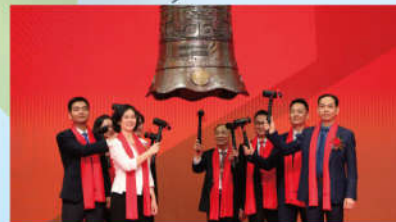
2021年5月，广东奇德新材料股份有限公司在深交所敲钟上市，成为创业板注册制江门“第一股”

纳入江门市“金种子”和“种子”企业名单的获奖企业有12家，其中优巨新材料、宝德利新材料已进入辅导环节，松田电工、阪桥电子等公司已与券商签约，已准备登陆主板，华龙膜材、润宇传感器、厚积工程等企业也在加速上市步伐；宝德利、迪浪科技、丽宫食品等已挂牌新三板；恒睿科技、科鼎材料等4家公司已在广东股权交易中心注册展示。