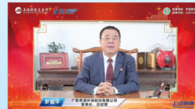
2021年8月，广东芳源环保股份有限公司在上交所“云敲锣”上市，成为江门首家在科创板上市挂牌的企业