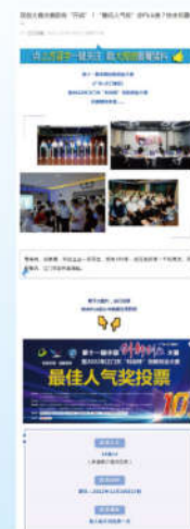
决赛科技企业微信投票