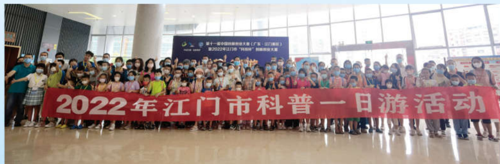
江门市“科普一日游”活动