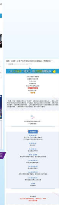
科普活动微信点赞