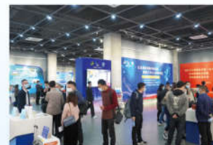
江门市工人文化宫成果展